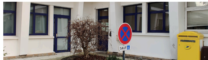
Rue Pierre Jestin (dans les anciens locaux de la Poste, près de la mairie)

- Finances publiques : retrouvez les informations nécessaires pour prendre RDV à la permanence de Plabennec. Service ouvert aux professionnels et aux particuliers.